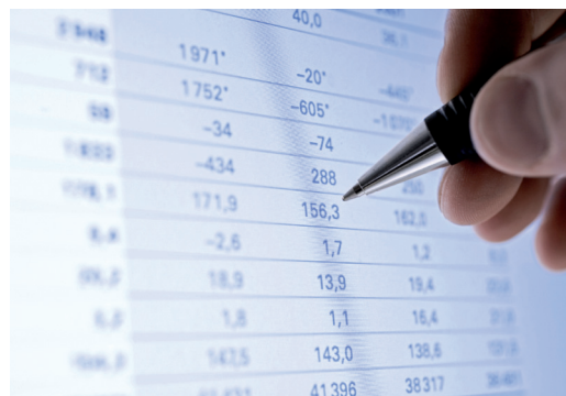
Image und Kundentypen.